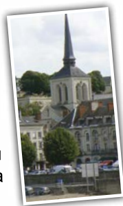
Колокольня церкви Сан Пьер

Силуэт замка – не единственное, что мы можем увидеть на горизонте. Колокольня церкви Сан Пьер также примечательна. У нее спирально слева направо извитый шпиль . В XVIII веке на башне колокольни был установлен остроконечный шпиль из дерева длиной в 69 метров.