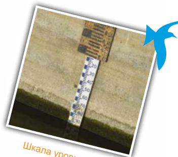
Шкала уровня воды

покровитель судовщиков и рыбаков Луары, церковь была построена в их честь. В XVIII веке судоходство Луары было в апогее славы, прежде чем оно было ослаблено созданием железной дороги. Хотя эта индустрия больше не существует, мы можем отметить, что судоходство было важно, так как набережные очень длинные. Кроме набережных и лодочных портовых скатов, на внутренней стороне арок моста Сессар Вы можете увидеть кольца для привязки судов . Все это напоминает нам о том, что проход под мостами был сложен.