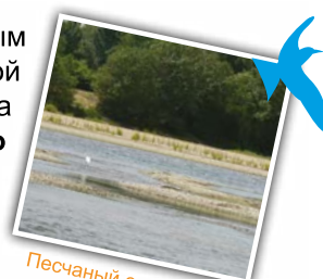
Песчаный островок с растительностью

Пройдя под железнодорожным мостом, мы подходим к более дикой зоне, где видны крутые берега реки. В центре Натурального регионального парка «Луара-Анжу-Турень» пейзаж, который мы можем наблюдать, характерен для наследия Луары: песчаный островок с растительностью справа от нас – один из первых примеров.