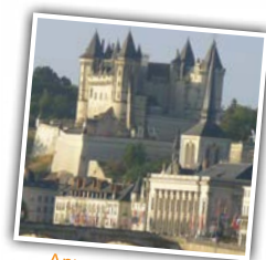
Архитектура из белого песчаника

год одна и та же температура, они используются для различных целей: выращивание шампиньонов, а также в качестве погребов и жилищ. Таким образом, выращивание Парижских шампиньонов (для которых требуется земляная основа на базе лошадиного навоза, температура 16°C, постоянная влажность и хорошая вентиляция –